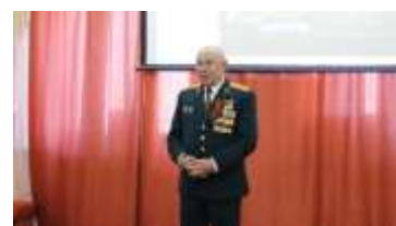
Выступление приглашенных гостей