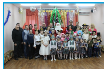
Театрализованное выступление воспитанников ОСП