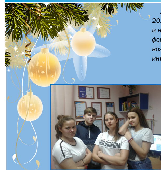
Всегда ваши – ред.коллегия «Радужной газеты»

Дорогие наши читатели, вот уже совсем скоро наступит Новый 2019 год. Новый год, новые события, новые задачи... Перемены ждут и наше издание. С января 2019 года «Радужная газета» изменит свой формат, теперь каждый выпуск будет тематическим. Может быть у вас возникли идеи, есть предложения, как сделать наше издание более интересным. Мы всегда готовы вас выслушать, ваше мнение важно!